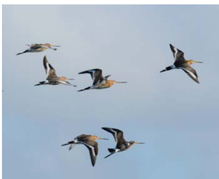
Barge à queue noire